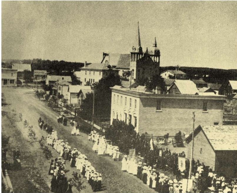
Archival view of St. Pierre-Jolys.

As noted, the development of this short list of significant sites was the result of careful and studied deliberations using standard heritage evaluation criteria, processes and scoring regimes. This work was carried out by the De Salaberry/St. Pierre Heritage Group with assistance from staff of the Historic Resources Branch of Manitoba Tourism, Culture, Heritage, Sport and Consumer Protection. We are grateful to the branch for their generous support and patient attention in this endeavour.